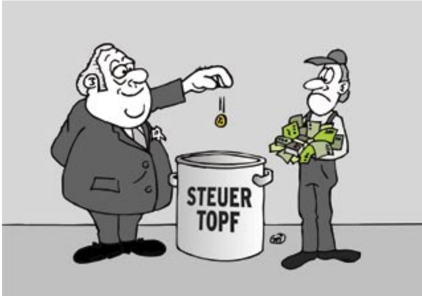
Cartoon: © Alexander Kautz

„Der Staat zieht den Bürgern Jahr für Jahr mehr Geld aus den Taschen, was die Bezieher niedriger Einkommen am härtesten trifft.“