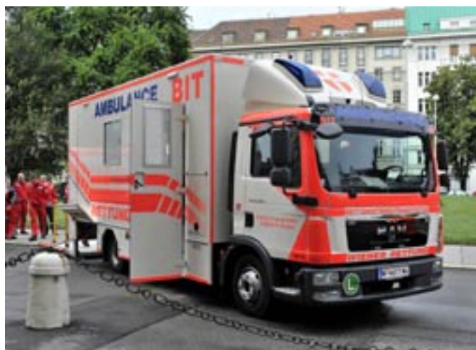
Der neue Bettenintensivtransporter bei seiner Präsentation.