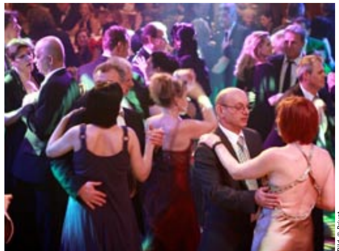
Viel Spaß beim Wiener Schulwarteball seit mehr als 40 Jahren

Dass der Schulwarteball ein kulturelles Ereignis ist, kann man als amtlich betrachten: Der Kultursender ARTE widmet diesem seit mehr als 40 Jahre alljährlich stattfindenden Fest einen eigenen Beitrag. Die Showeinlagen steuerten wieder die PersonalvertreterInnen der SchulwartInnen bei, die zeigen, dass sie doch noch ein Stückl mehr können als fachliche Kompetenz zu beweisen.